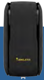
Art.-Nr. Pura Hygiene 83 2001