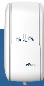
Art.-Nr. Pura Hygiene 82 2000

Spender für 800 ml Desinfektionsschaum (automatische Auslösung durch Infrarotsensor). Keine Berührung mit dem Spender. Abgerundete Oberseite verhindert das Ablegen von Abfall. Durch Auftragen des desinfizierenden Schaums auf Toilettenpapier und anschliessende Reinigung des WC-Sitzes sorgt der Benutzer selbst für wirksame Hygiene. Service durch Pura Hygiene möglich.