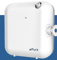
Art.-Nr. Pura Hygiene 82 1300

Das Gerät ist mit einer Technik ausgestattet, dass den flüssigen Duft in einem leichten Duftnebel zerstäubt, der lange in der Luft bleibt. Vollständig programmierbar (über Bluetooth/ App). Duftstoff wird gleichmässig und konstant verteilt. Sehr geringer Batterieverbrauch. Das Gerät kann auch mit Strom betrieben werden. Verschiedene Duftnoten vorhanden. Service durch Pura Hygiene möglich