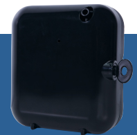
Art.-Nr. Pura Hygiene 83 1301